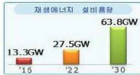
'30년 재생에너지 설비용량(누적)